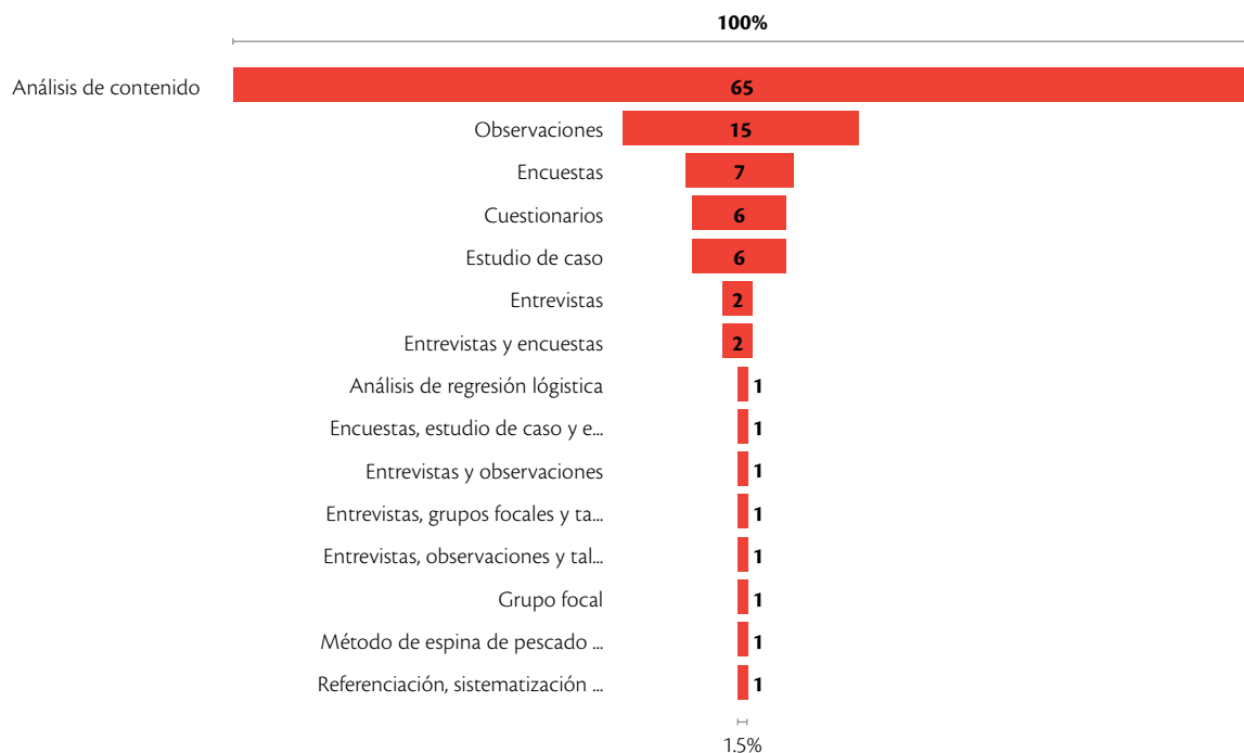
Figura 3. Metodologías empleadas

Cabe resaltar que 24 instituciones corresponden a Norteamérica; 21 a Europa: Reino Unido (8), Holanda (4), Francia (3), Alemania (2), España (2), Italia