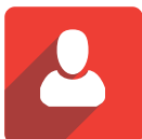
Tabla 1. Resumen del proyecto